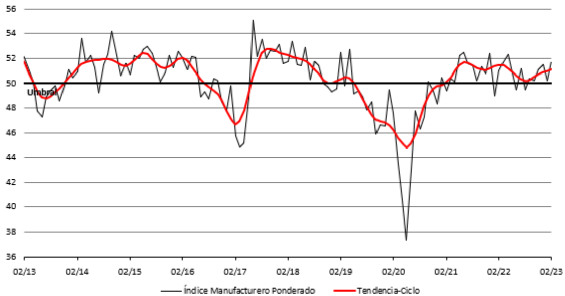
Cuadro 1: Indicador IMEF Manufacturero y sus componentes