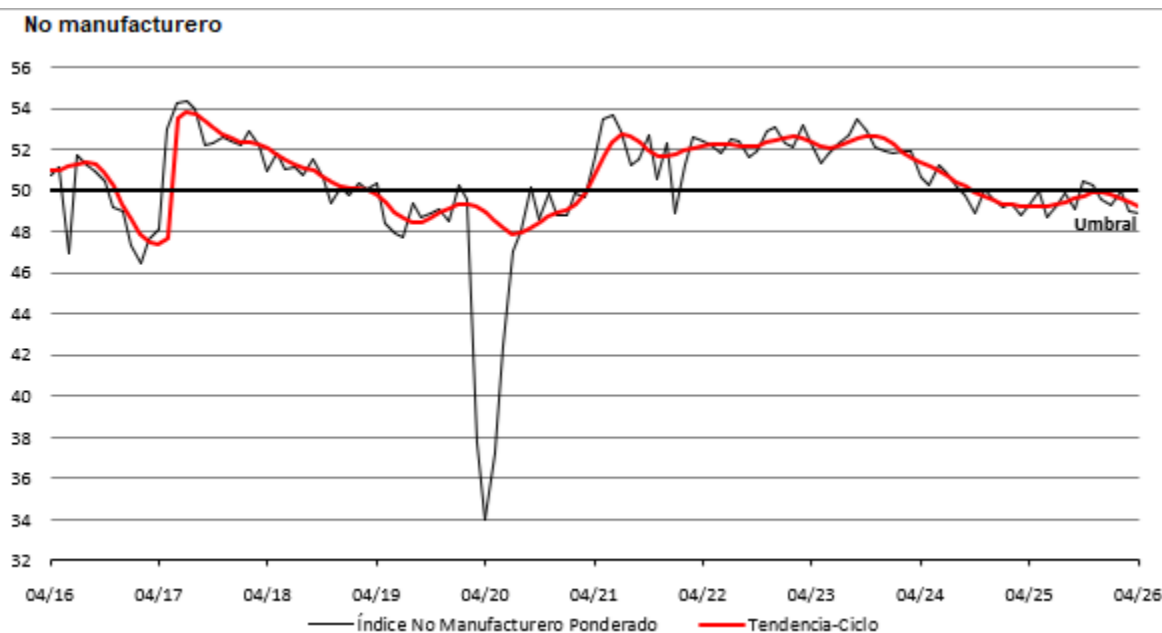
Gráfica 3: Indicador IMEF No Manufacturero y su tendencia-ciclo

La gráfica del Indicador IMEF No Manufacturero correspondiente a abril de 2026 confirma la persistencia de un entorno de debilidad en el sector servicios y comercio. Tanto la línea del Indicador ponderado como la tendencia-ciclo se mantienen por debajo del umbral de expansión, aunque con una ligera estabilización en las lecturas más recientes. Este comportamiento sugiere que, tras la pérdida de impulso observada a inicios del año, la actividad ha dejado de deteriorarse al mismo ritmo, pero aún no muestra una recuperación clara. La ausencia de una pendiente ascendente sostenida en ambas series indica que la dinámica del sector continúa siendo frágil, con dificultades para consolidar una fase expansiva en el corto plazo.